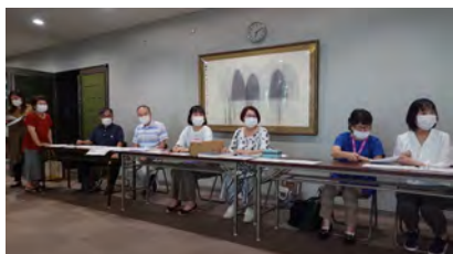
▲ お世話係のみなさん

6/27 (日) ◆はじめてで歌詞の発音などよくわかっていないので、また家で練習しておきます。◆わすれているところがありました。がんばります。♥まったく忘れていたのかな…と思っていましたが、歌うと覚えていてうれしいです。でも、また初心にかえったつもりで練習に取り組みます。♣みなさま、こんにちは。調子はいかがですか? 1年のお休みがこれほどひと呼吸おくれで思い出しました。気を引き締めて声が元に戻ることをねがってがんばります。ありがとうございます。よろしくおねがいします。♣全力で歌わんとテノールは歌えん。大変じゃー。(KC)